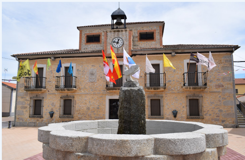
Sancti-Spíritus (Plaza del Ayuntamiento).